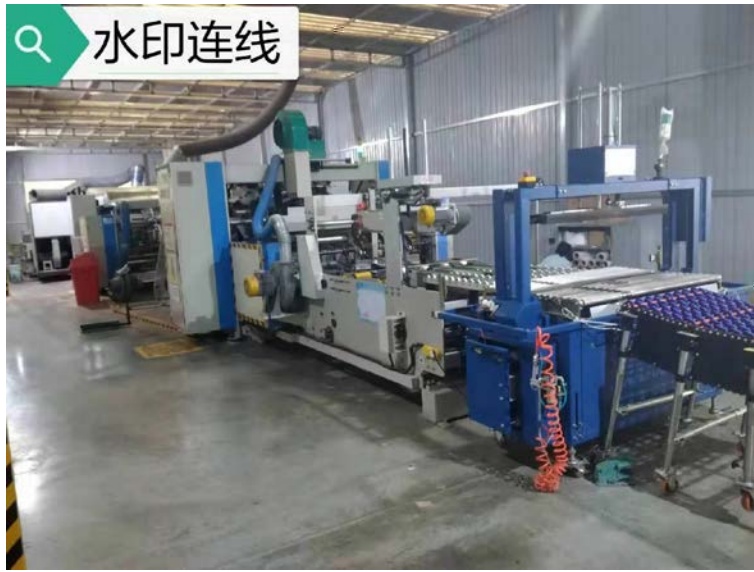
. 4-2 gj