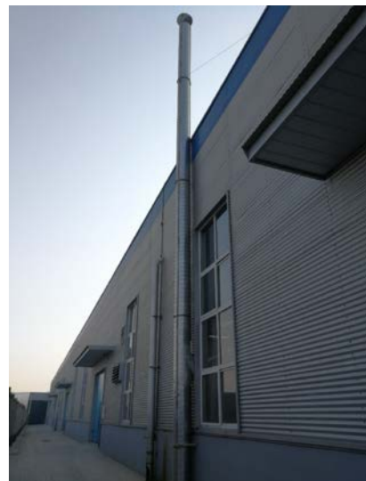
. 7 15m Â"D1,