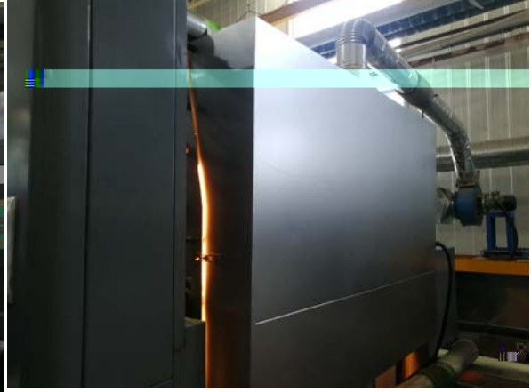
. 4-5 g jLÖ"D5™