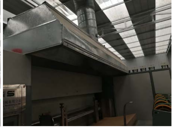
. 4-3 gj: éLö"D5™